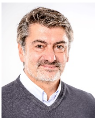
Modulverantwortlicher Fachgebiet IT-Sicherheitsarchitekturen, Hochschule Bremen

„IT-Sicherheit und Datenschutz werden immer wichtiger! Gerade mittelständische Unternehmen und Selbstständige müssen sich besser schützen. Auch ohne IT-Hintergrund lernen Sie bei uns, mit den richtigen organisatorischen und technischen Maßnahmen Ihre IT-Systeme rechtskonform abzusichern.“