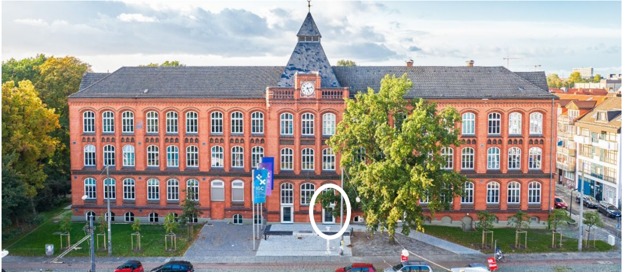
Grafik 1: Bild aus der Mediathek (Media ID 55928977)