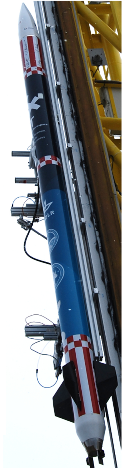
AQUASONIC auf der Startrampe

Komm vorbei in FL419 (ZIMT) Ruf uns an: 0421/5905 – 5523 Schreib uns: info@aquasonic.de