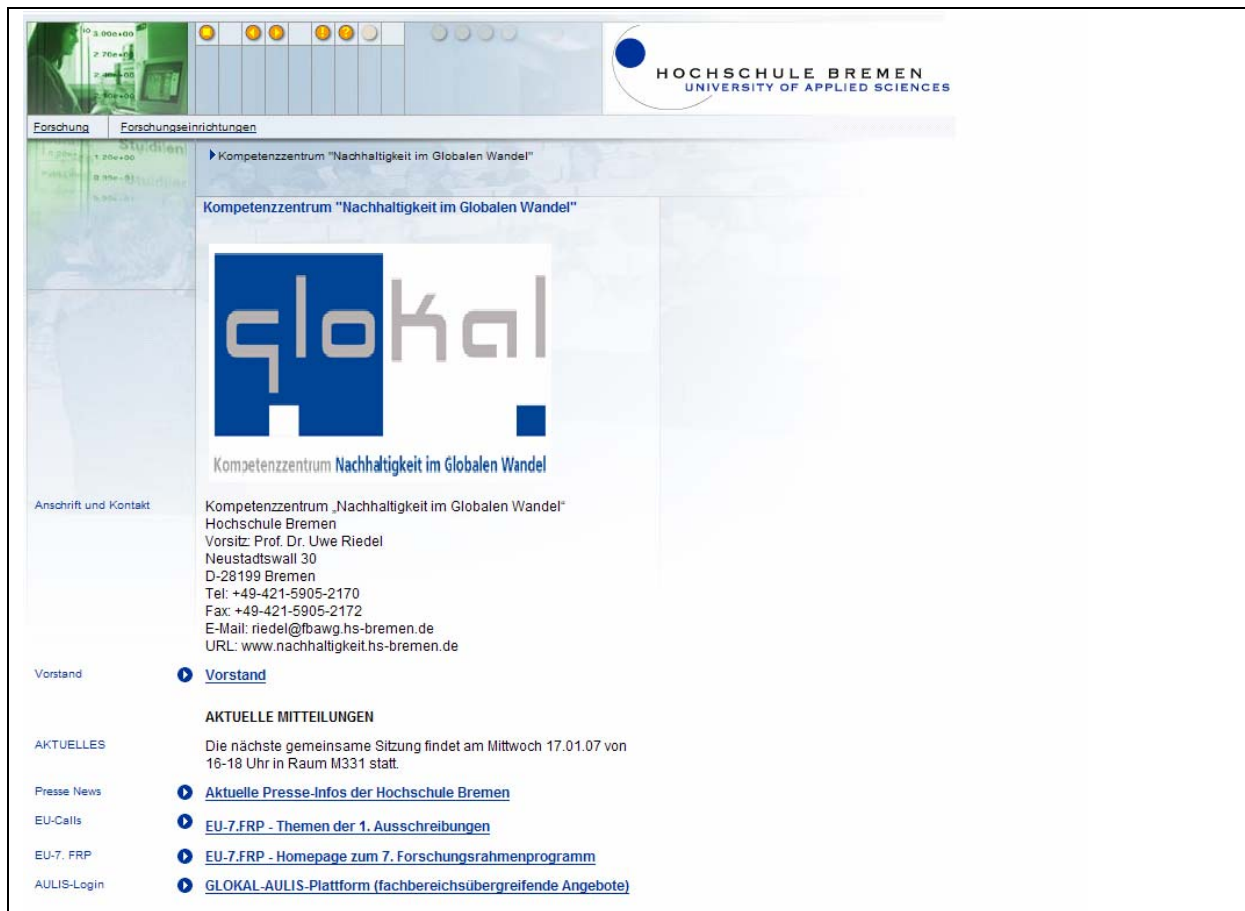
Abb. 04: Screenshot der Homepage www.nachhaltigkeit.hs-bremen.de