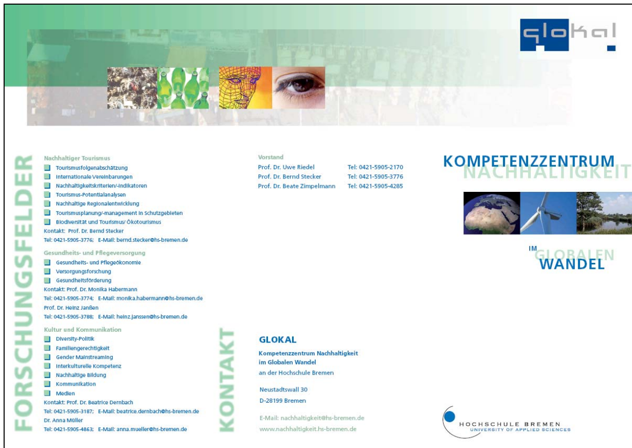
Abb. 03: Entwurf des Flyers