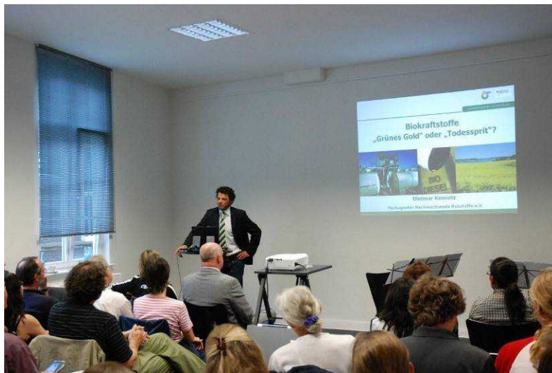
Foto: Veranstaltung von GLOKAL im Haus der Wissenschaft