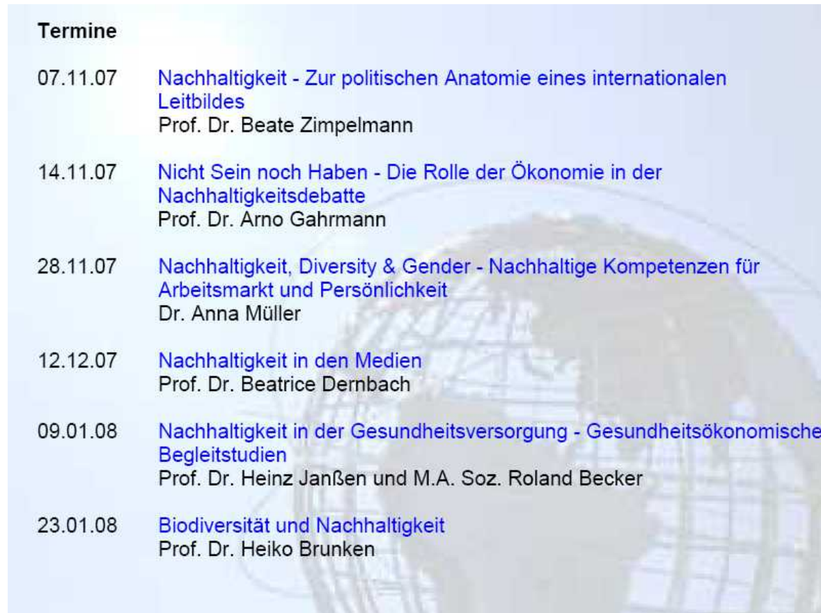
Abb.2: Termine der 1. Ringvorlesung der Hochschule Bremen zur Nachhaltigen Entwicklung