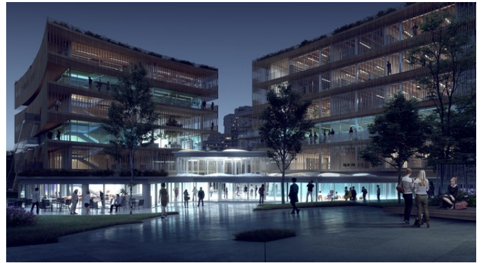
Campus Neubau der Pôle Universitaire Léonard de Vinci, Partnerhochschule Paris

Das Sommersemester 2021 ist nun schon das dritte Online-Semester aufgrund der Corona-Krise.